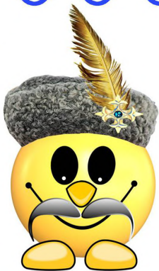
Wycieczka nr A09