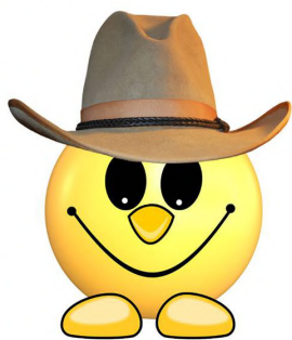
Wycieczka nr 184