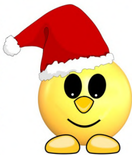
Wycieczka nr #16